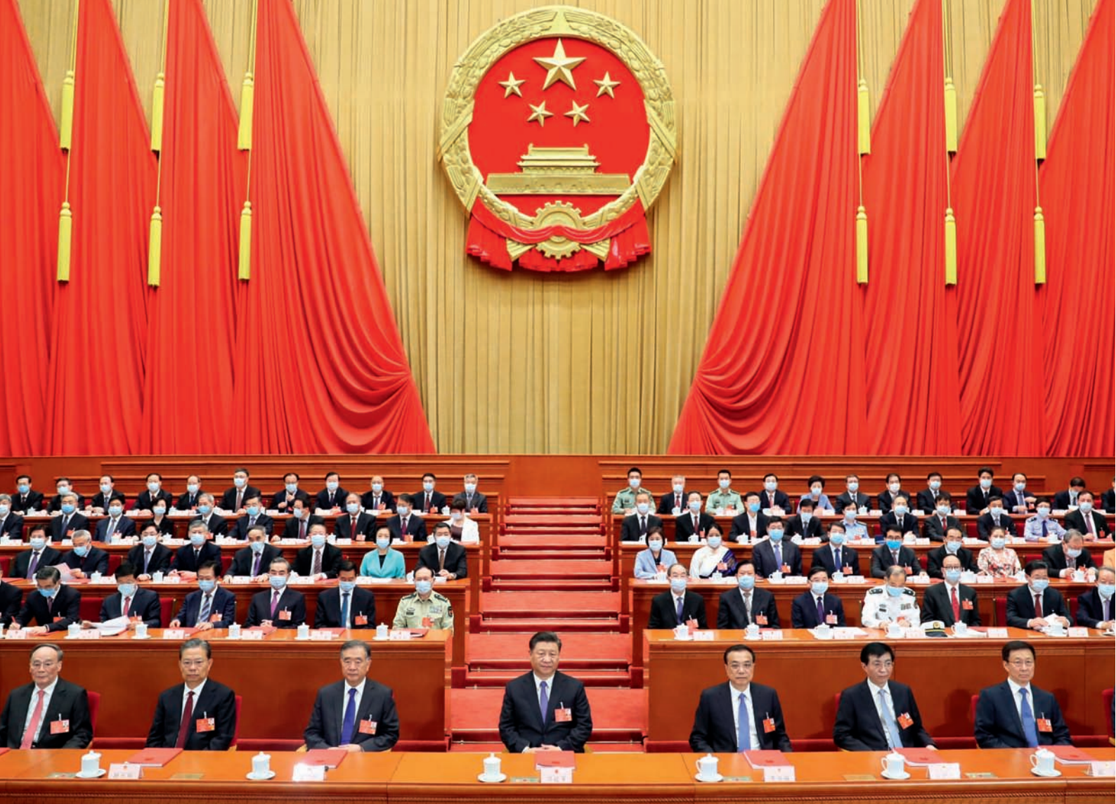
5月28日，第十三届全国人民代表大会第三次会议在北京人民大会堂闭幕。党和国家领导人习近平、李克强、汪洋、王沪宁、赵乐际、韩正、王岐山等在主席台就座，栗战书主持闭幕会并发表讲话。