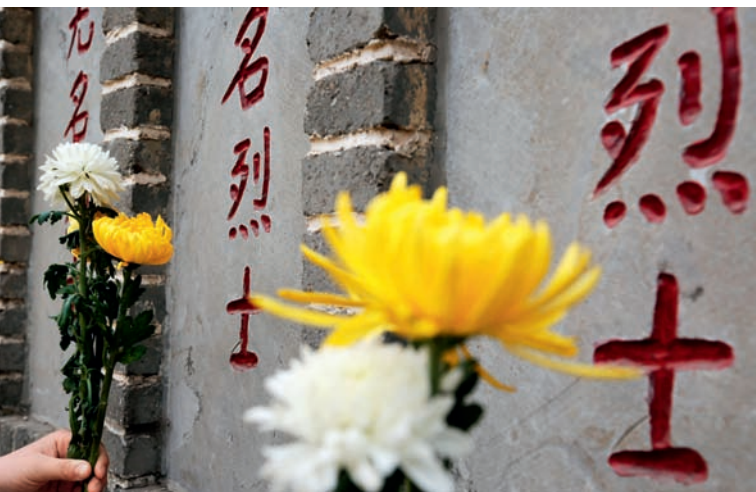
烈士是党和国家授予这些英雄的最高荣誉称号。英烈的事迹和精神是中华民族宝贵的精神财富。