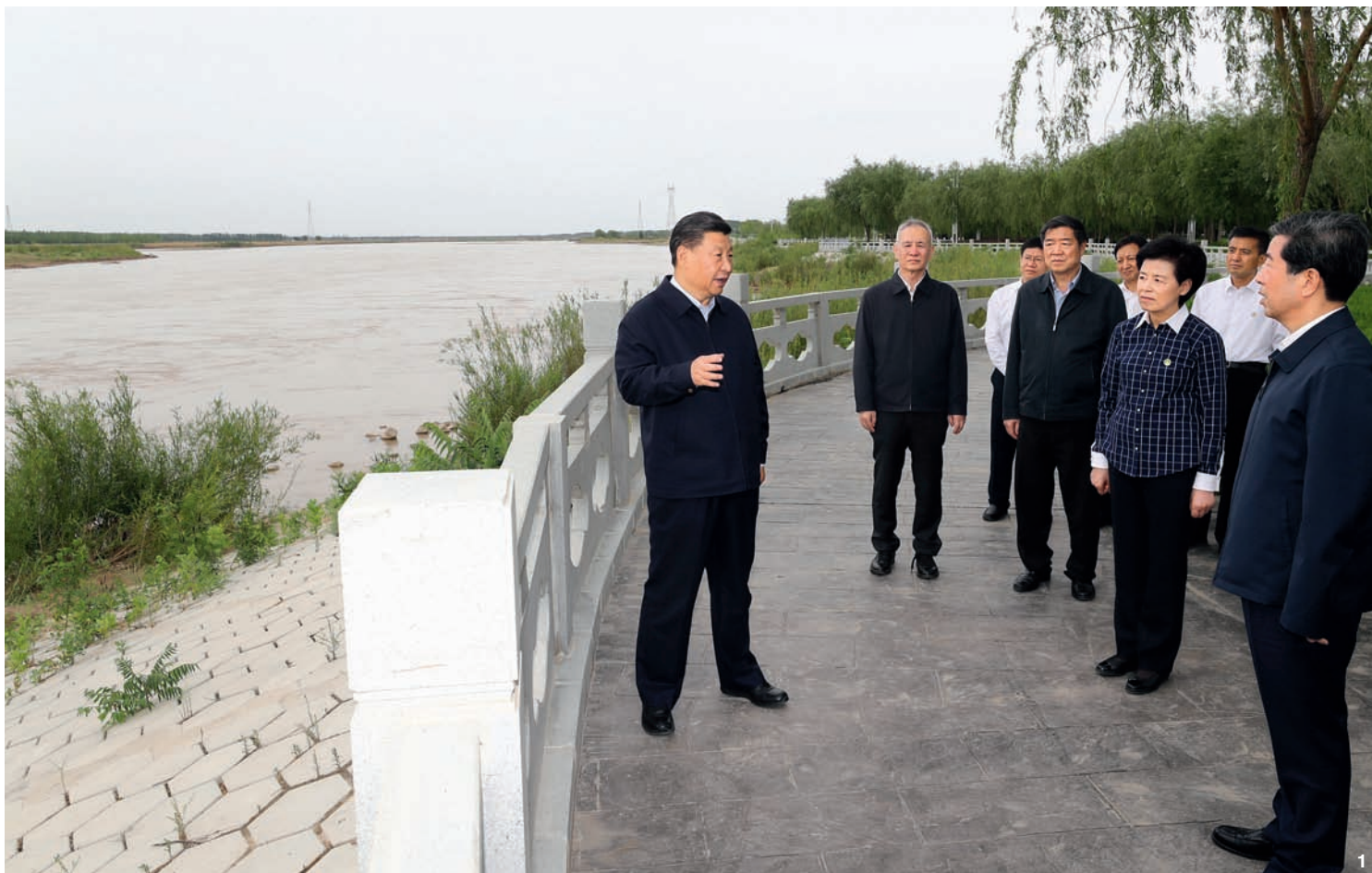
① 6月8日至10日,中共中央总书记、国家主席、中央军委主席习近平在宁夏考察。这是6月8日下午,习近平在黄河吴忠滨河大道古城湾砌护段,察看黄河生态治理保护状况。