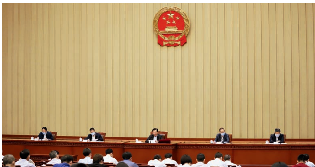
6月9日，中共中央政治局委员、全国人大常委会副委员长王晨出席十三届全国人大三次会议代表建议、批评和意见交办会并讲话。

王晨指出，会议期间，全国人大代表共提出506件议案、9180件建议。许多人大代表心系大局、深入基层、调查研究，特别是在统筹推进疫情防控和经济社会发展中结合履职工作实际，提出高质量的议案和建议，反映民情民意、汇聚民智民力。这是人民当家作主的充分