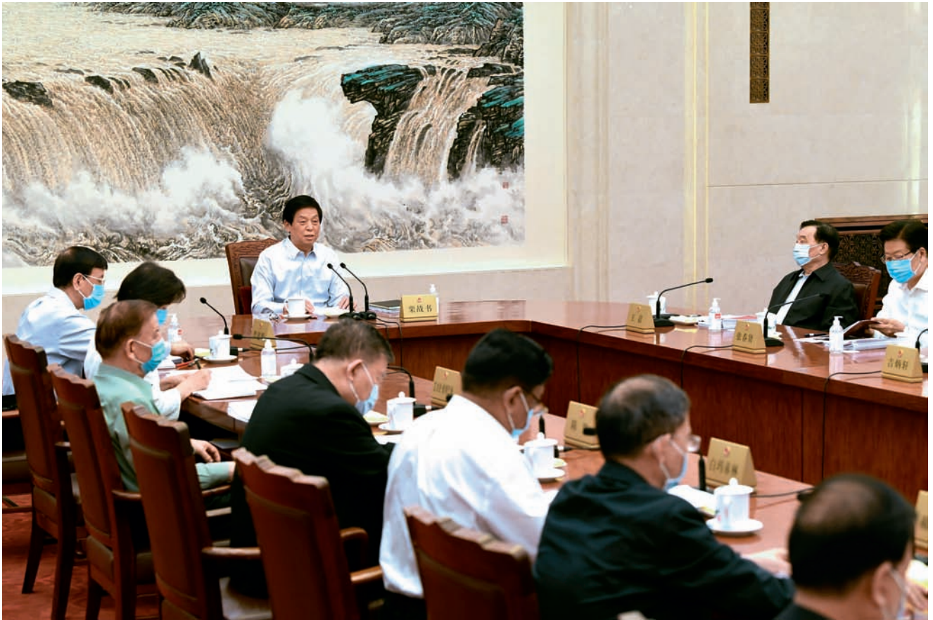
6月9日,十三届全国人大常委会在北京人民大会堂召开第五十九次委员长会议。栗战书委员长主持会议。