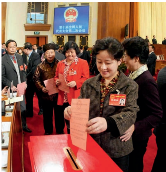
2004年3月14日，十届全国人大二次会议表决通过宪法修正案，将“国家尊重和保障人权”写入宪法。

人格权是民事主体对其特定的人格利益享有的权利，关系到每个人的人格尊严，是民事主体最基本、最重要的权利，是公民行使其他一切权利和自由的前提和基础。1982年宪法第三十七条至第四十条对保护公民人身自由和人格尊严作出了基本规定。2004年宪法修改时，将“国家尊重和保障人权”载入宪法，表明了我国坚持和推进社会主义