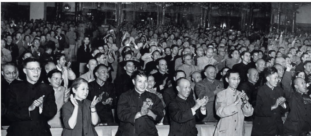
1954年9月20日，一届全国人大一次会议通过《中华人民共和国宪法》。1954年宪法第一次明确将保护人身自由写入宪法。

编纂民法典是党的十八届四中全会提出的重大立法任务，是以习近平同志为核心的党中央作出的重大法治建设部署。2020年5月28日，十三届全国人大三次会议高票通过了《中华人民共和国民法典》，以法典化方式确认、巩固和发展了改革开放以来所取得的法治建设成果，为坚持和完善中国特色社会主义制度、推进国家治理体系和治理能力现代化提供了有力的法治保障。其中，与合同编、物权编等对现行民事法律规范进行系统整合、修改完善不同，民法典在总结我国现有人格权法律规范的实践经验基础上，单独设立了人格权编。自2018年8月十三届全国人大常委会第五次会议对民法典各分编草案进行了初次审议以来，人格权编草案经过全国人大常委会多次审议，不断修改完善。人格权编作为民法典的重要组成部分顺利出台，对于落实我国宪法关于人身自由与人格尊严的规定，保障公民基本权利，切实回应人民群众的法治需求，