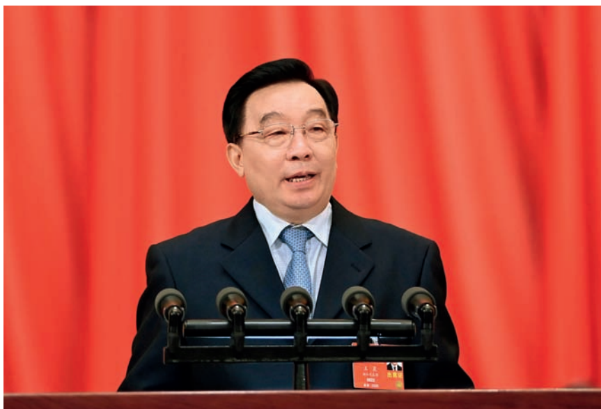
5月22日，十三届全国人大三次会议在北京人民大会堂开幕。受全国人大常委会委托，全国人大常委会副委员长王晨作关于民法典草案的说明。