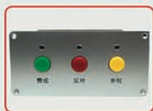
双核心双通道嵌入式表决器