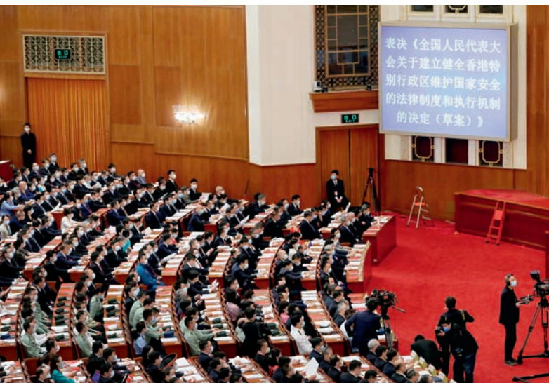
5月28日，十三届全国人大三次会议在北京人民大会堂闭幕。会议表决通过了《全国人民代表大会关于建立健全香港特别行政区维护国家安全的法律制度和执行机制的决定》。决定自公布之日起施行。

四是坚决反对外来干涉。香港特别行政区事务是中国的内政，不受任何外部势力干涉。必须坚决反对任何外国及其组织或者个人以任何方式干预香港事务，坚决防范和遏制外部势力干预香港事务和进行分裂、颠覆、渗透、破坏活动。对于任何外国制定、实施干预香港事务的有关立法、行政或者其他措施，国家将采取一切必要措施予以反制。