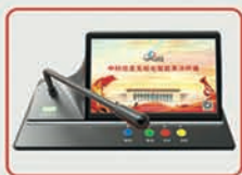
嵌入式智能表决终端