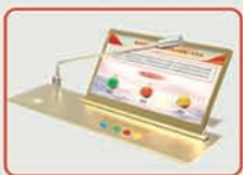
升降式智能表决终端