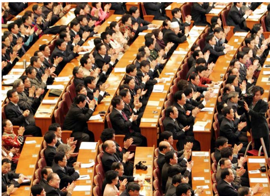
2005年3月14日，十届全国人大三次会议在北京人民大会堂举行闭幕会。图为会议审议并高票通过《反分裂国家法》后，代表们热烈鼓掌。

等方面创造更好的条件，进一步密切了两岸同胞的感情。我们贯彻以人民为中心的发展思想，对台湾同胞一视同仁，继续率先同台湾同胞分享大陆发展机遇，继续完善促进两岸交流合作、深化两岸融合发展、保障台湾同胞福祉的制度安排和政策措施，把融合发展的道路越走越宽广。