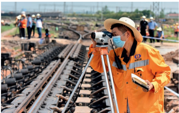
6月4日，工人在武汉北编组站扩能改造工地施工作业。

全国人大代表杨国占表示，新业态、新模式、新市场的培育，能让传统产业升级换代、优势产业扩大优势、新兴产业更加蓬勃发展。他建议，各地各