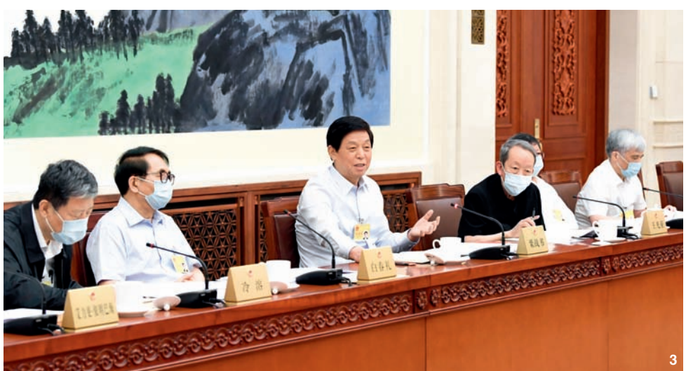
② 6月18日,十三届全国人大常委会第十九次会议在北京人民大会堂举行第一次全体会议,栗战书委员长主持。