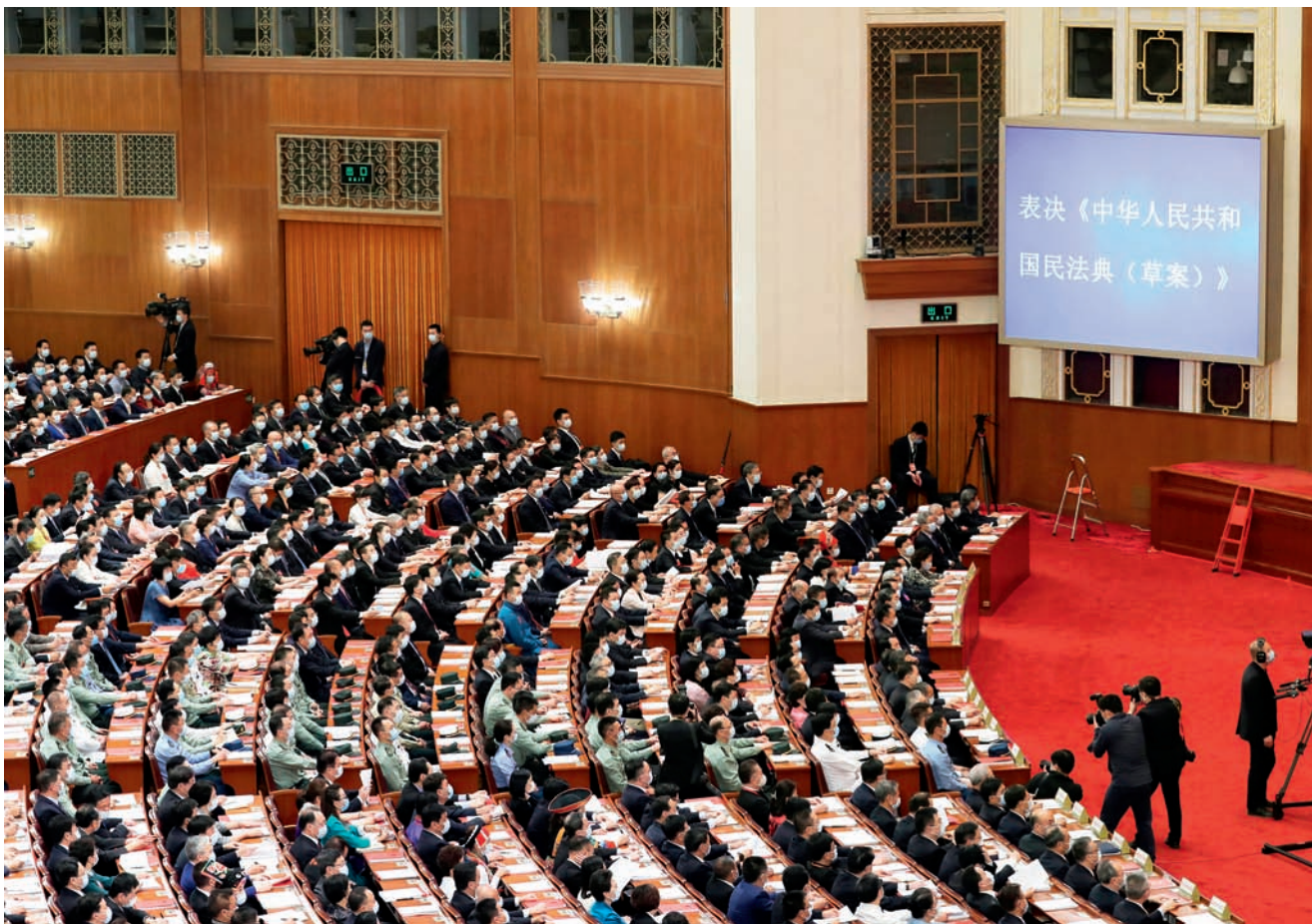
5月28日，第十三届全国人民代表大会第三次会议在北京人民大会堂闭幕。

行社会主义市场经济体制和加强社会主义法治建设取得的一系列重要制度成果用法典的形式确定下来，规范经济生活和经济活动赖以依托的财产关系、交易关系，对坚持和完善社会主义基本经济制度、促进社会主义市场经济繁荣发展具有十分重要的意义。要讲清楚，实施好民法典是提高我们党治国理政水平的必然要求。民法典是全面依法治国的重要制度载体，很多规定同有关国家机关直接相关，直接涉及公民和法人的权利义务关系。国家机关履行职责、行使职权必须清楚自身行为和活动的范围和界限。各级党和国家机关开展工作要考虑民法典规定，不能侵犯人民群众享有的合法民事权利，包括人身权利和财产权利。