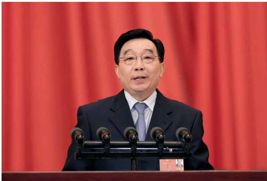
5月22日，十三届全国人大三次会议在北京人民大会堂开幕。受全国人大常委会委托，全国人大常委会副委员长王晨作关于《全国人民代表大会关于建立健全香港特别行政区维护国家安全的法律制度和执行机制的决定(草案)》的说明。

香港回归以来，国家坚定贯彻“一国两制”、“港人治港”、高度自治的方针，“一国两制”实践在香港取得了前所未有的成功；同时，“一国两制”实践过程中也遇到了一些新情况新问题，面临着新的风险和挑战。当前，一个突出问题就是香港特别行政区国家安全风险日益凸显。特别是2019年香港发生“修例风波”以来，反中乱港势力公然鼓吹“港独”“自决”“公投”等主张，从事破坏国家统一、分裂国家的活动；公然侮辱、污损国旗国徽，煽动港人反中反共、围攻中央驻港机构、歧视和排挤内地在港人员；蓄意破坏香港社会秩序，暴力对抗警方执法，毁损公共设施和财物，瘫痪政府管治和立法会运作。还要