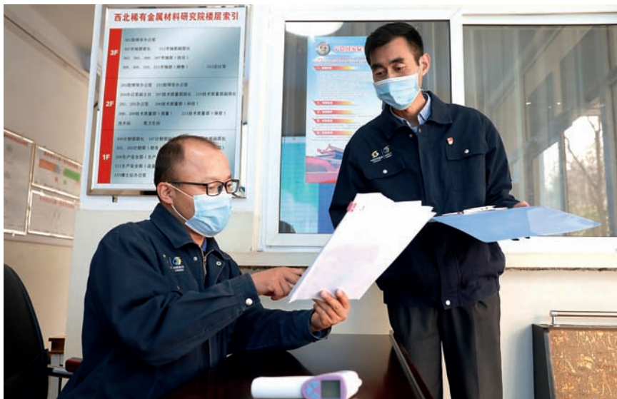
全国人大代表王东新(右)检查职工体温登记情况。

全国人大代表王东新所在的西北稀有金属材料研究院宁夏有限公司(以下简称西材院)是“两弹一星”的参研单位,也是我国唯一的铍材料研制基地、国防军工重点配套企业。近几年,随着我国各项事业的快速健康发展,西材院研制的材料已经广泛应用于武器装备、航空航天、核电、卫星以及大科学工程项目等,每一项工作都任务重、任务急。