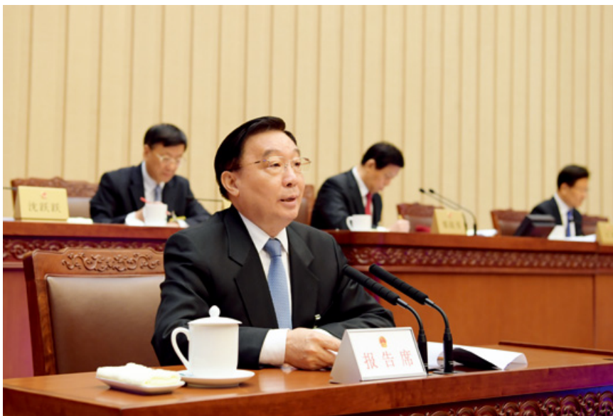
2019年12月28日，十三届全国人大常委会举行第十五讲专题讲座，栗战书委员长主持。全国人大常委会副委员长王晨作了题为《深入学习贯彻党的十九届四中全会精神，坚持和完善人民代表大会制度这一根本政治制度》的讲座。

党的十九届四中全会是在重要历史交汇点上召开的一次具有开创性、里程碑意义的重要会议。全会审议通过的《决定》对坚持和完善中国特色社会主义制度、推进国家治理体系和治理能力现代化作出顶层设计和全面部署，深入回答了在我国国家制度和治理体系上应该“坚持和巩固什么、完善和发