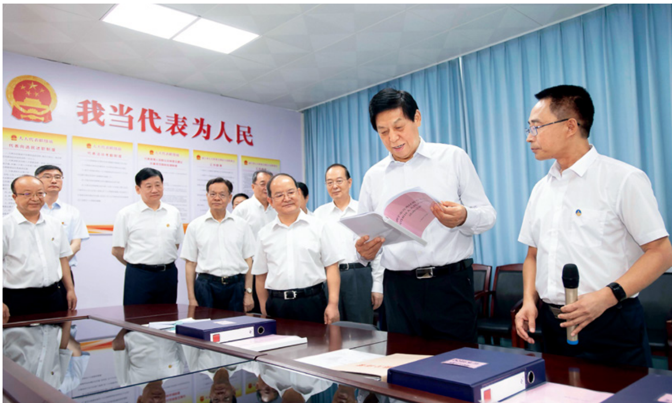
7月12日至15日，中共中央政治局常委、全国人大常委会委员长栗战书率全国人大常委会执法检查组在广西检查“一决定一法”的实施情况。这是7月12日，栗战书在南宁市青秀区新竹社区调研人大代表联络站和基层立法联系点建设情况。

把全国人大常委会有关决定和野生动物保护法学习好、宣传好、贯彻好、实施好。野生动物及其栖息地保护的工作任务主要在地方，地方的责任很大、担子很重。除了“一决定一法”，还要实施好环境保护法、森林法、草原法等相关法律，一个条款一个条款对照落实，切实把法律制度的引领、规范、保障作用发挥出来，使法律制度成为人与自然的共同的守护神。