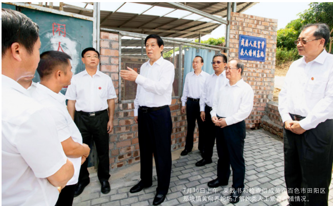
7月15日上午，栗战书和检查组成员在百色市田阳区那坡镇黄向养蛇场了解蛇类人工繁育养殖情况。