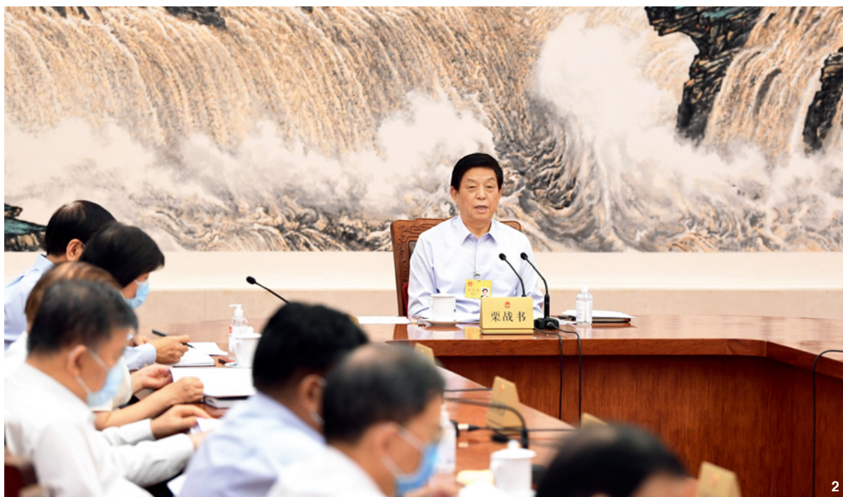
② 6月19日,十三届全国人大常委会第六十一次委员长会议在北京人民大会堂举行,栗战书委员长主持会议。