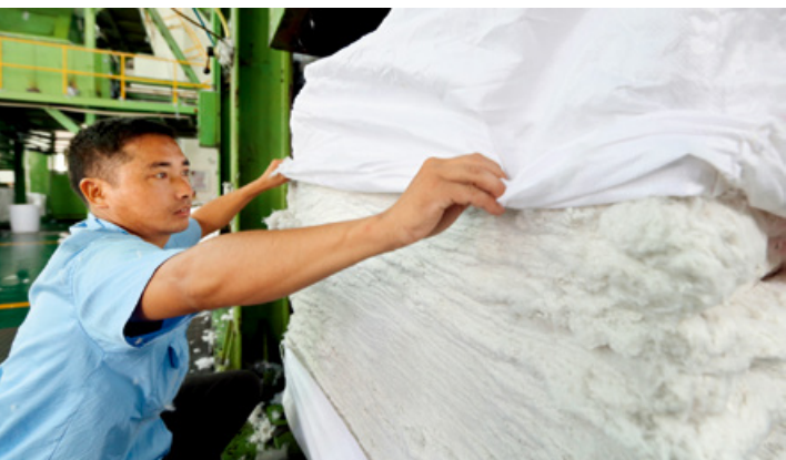
在福建省泉州市，一些企业将废旧塑料瓶变身成纺织纤维等产品，实现“变废为宝”。

他还建议，国家加大政策支持和扶持力度，以专项扶持资金、税收减免等方式，鼓励以企业为主体开展合成、改性和回收处理等技术攻关及产业化发展，支持建设工业示范装置。除此之外，还应加大对资本市场融资支持力度，支持行业领先企业在科创板上市。☑