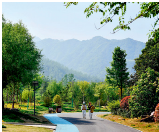
市民在陕西省西安市长安区秦岭违建别墅拆除后建设的秦岭和谐森林公园内散步。

6月23日，西安市人大常委会召开新闻发布会，发布《西安市秦岭生态环境保护条例》，督促市和相关区、县人