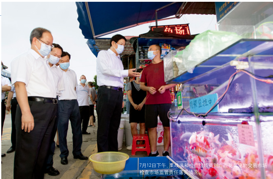
7月12日下午,栗战书和检查组成员到广西花鸟宠物交易市场检查市场监管责任落实情况。