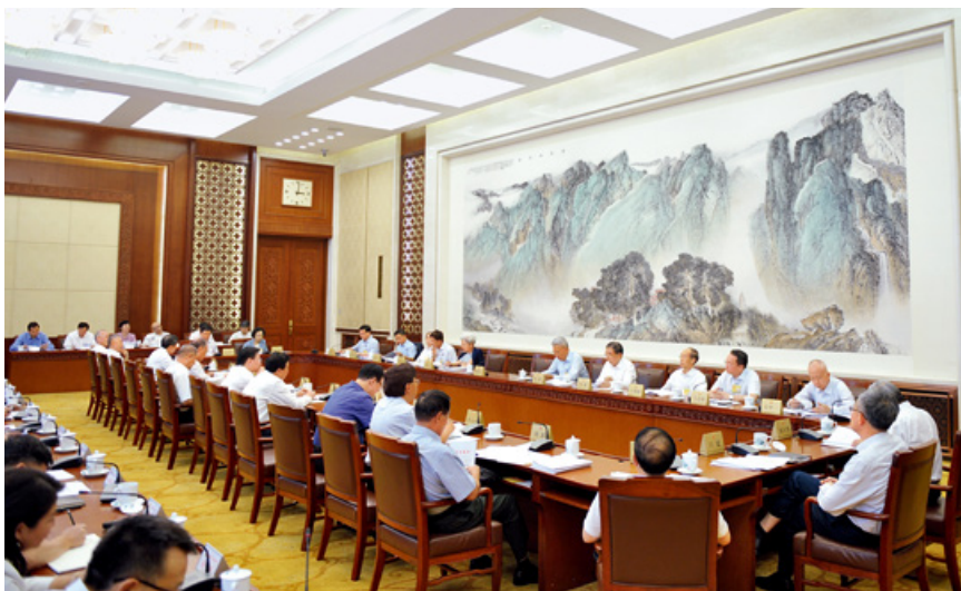
2019年8月25日下午，十三届全国人大常委会第十二次会议举行分组会议，审议公职人员政务处分法草案等。

在如何规范具体的行政行为方面，立法机关最初计划制定一部统一的行政程序规则，对所有的行政行为进行统一规范。但因为当时立法基础比较薄弱，制定统一的行政程序规则存在较