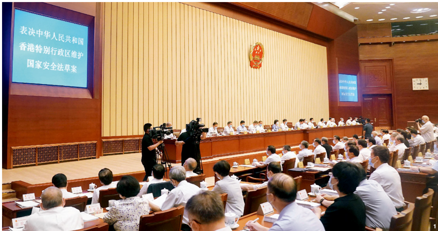
① 6月30日,十三届全国人大常委会第二十次会议在北京人民大会堂举行第二次全体会议,栗战书委员长主持。会议经表决,全票通过《中华人民共和国香港特别行政区维护国家安全法》。