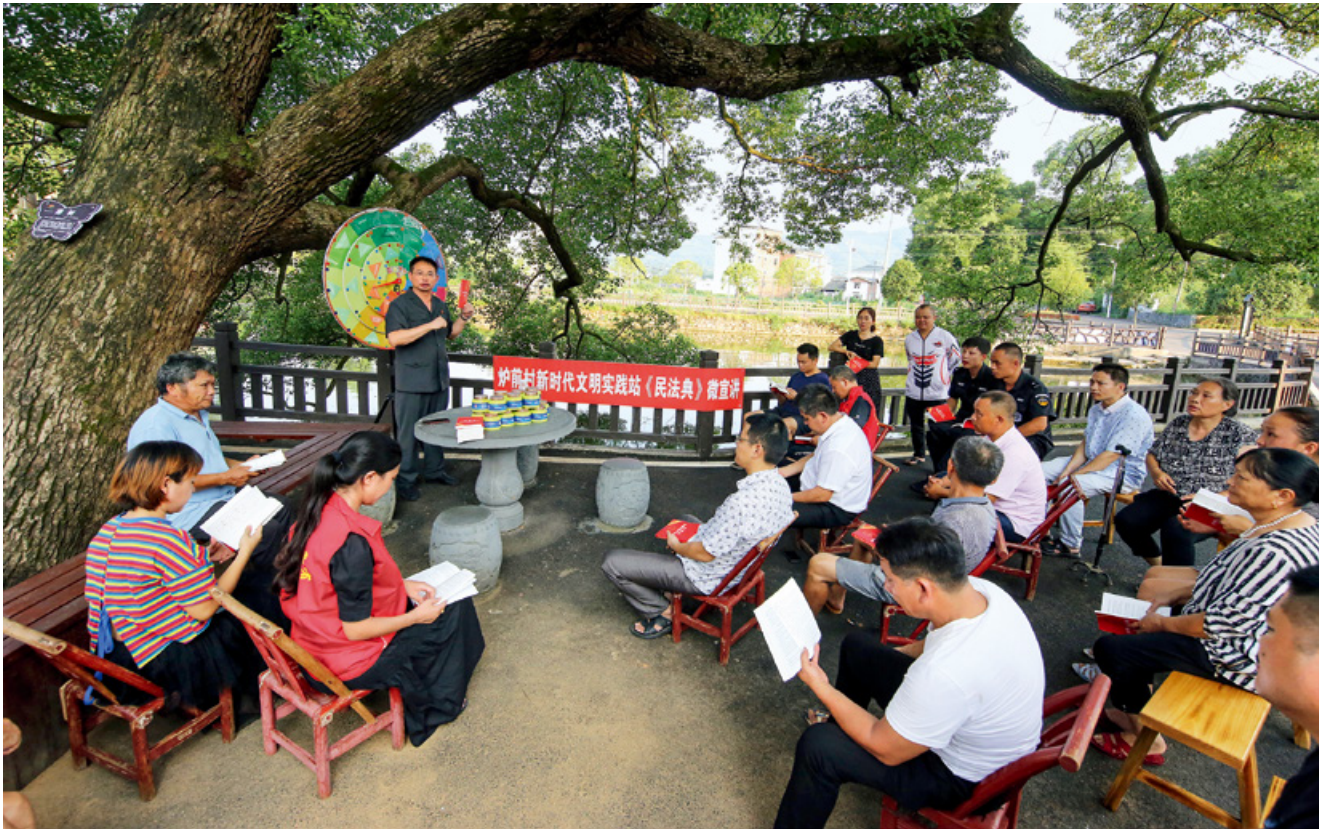
7月15日,在江西省萍乡市湘东区腊市镇炉前村,普法志愿者在向村民宣讲《中华人民共和国民法典》。