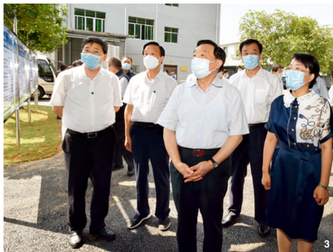
③ 7月13日至16日,中共中央政治局委员、全国人大常委会副委员长王晨率全国人大常委会执法检查组在江西检查全国人大常委会全面禁食野生动物有关决定和野生动物保护法实施情况。这是7月14日,王晨同志一行在景德镇市陈锋特种野生动物科技开发有限公司进行检查。