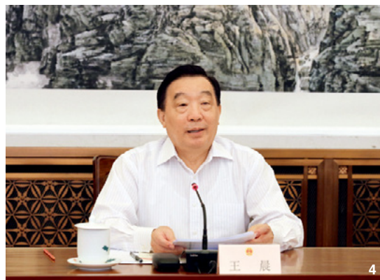
④ 7月17日,中共中央政治局委员、全国人大常委会副委员长王晨出席全国人大常委会慈善法执法检查组第一次全体会议并讲话。