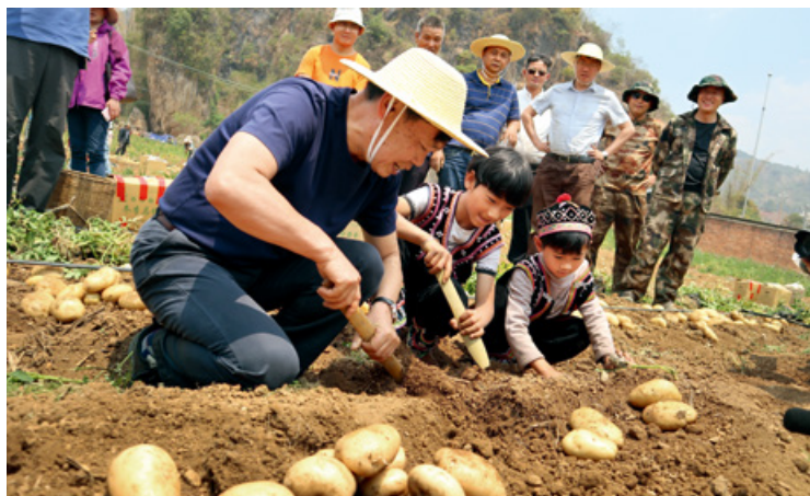
2020年4月7日,朱有勇代表(左一)专门请购物网站的人直播拉祜族人挖土豆的场面,当天挖出的25吨土豆销售一空。

转眼3个多月过去,2017年初春,在土豆采挖的时候,蒿枝坝村破天荒迎来反季节的丰收。村民们从来没见过土豆能长出这么多,个头儿这么大!