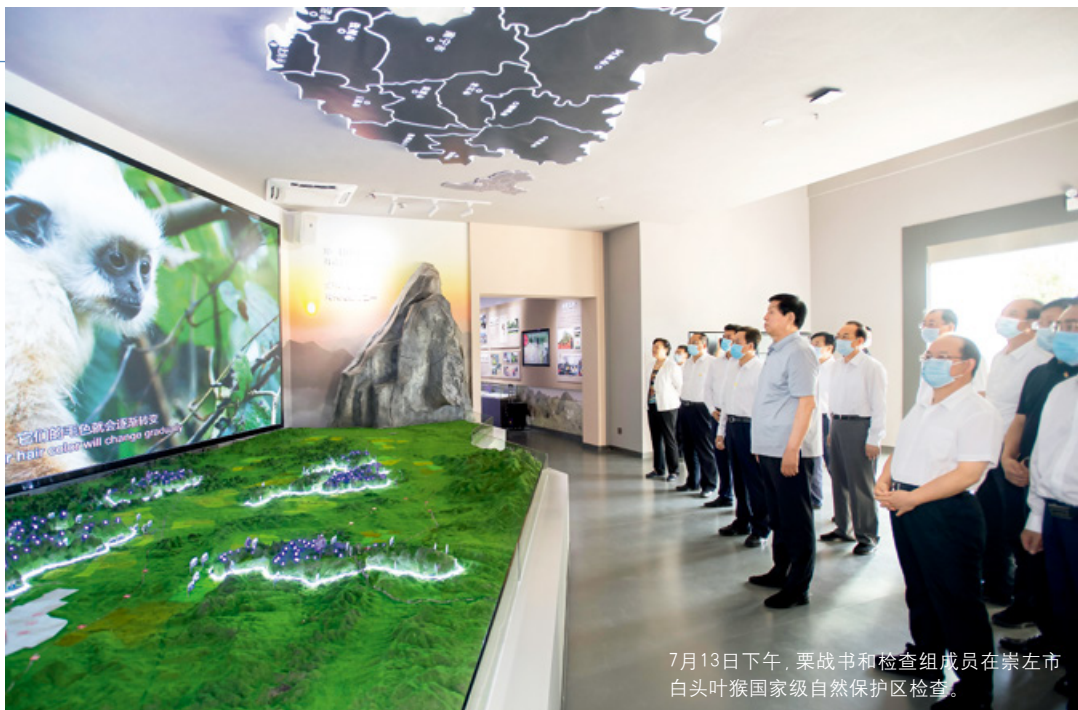
7月13日下午，栗战书和检查组人员在崇左市白头叶猴国家级自然保护区检查。