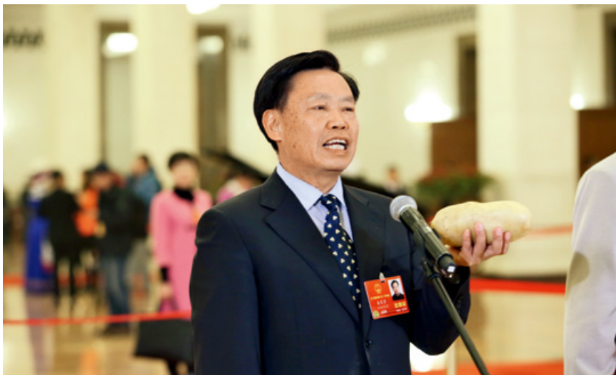
2018年3月13日，在十三届全国人大一次会议的第四场“代表通道”上，朱有勇代表手举一颗澜沧产的土豆向中外媒体展示。