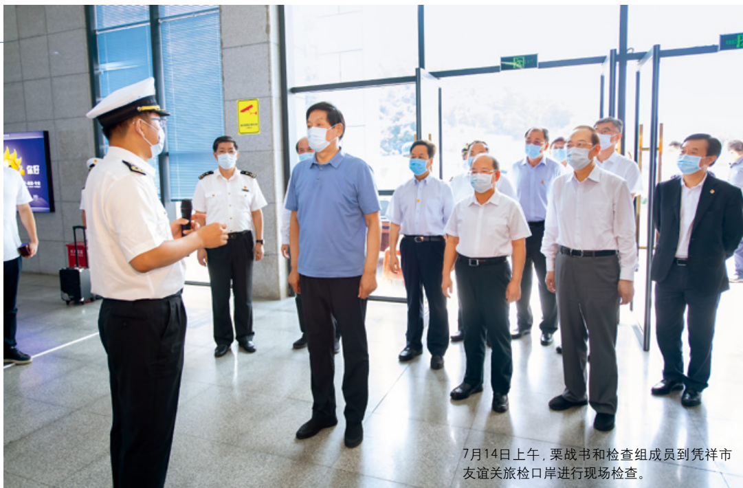
7月14日上午，栗战书和检查组成员到凭祥市友谊关旅检口岸进行现场检查。