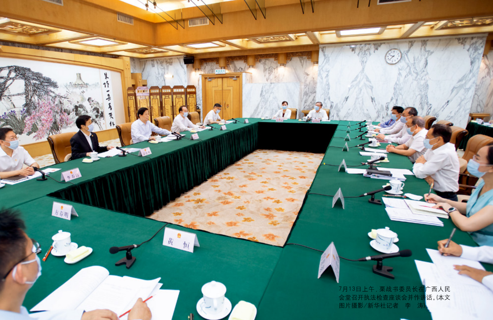
7月13日上午，栗战书委员长在广西人民大会堂召开执法检查座谈会并作讲话。