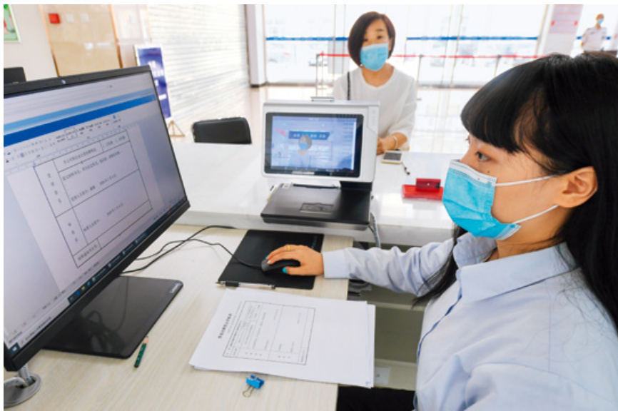
为进一步优化营商环境,河北省廊坊市广阳区全力打造“互联网+政务服务”的智能服务体系,实现线上、线下互联,为企业和群众提供办事智能化、全程电子化的服务。

与此同时,在大数据时代,数据驱动社会发展的势头越来越明显,公共数据开放、共享的格局已经是必然的趋