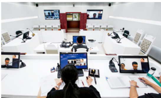
南宁市兴宁区法院率先在全区启用广西移动微法院的网上开庭平台进行互联网开庭

秩序；审结破产案件515件，“田七”牙膏、“睡宝”床垫等知名产品恢复正常生产，阳鹿高速公路全线通车。