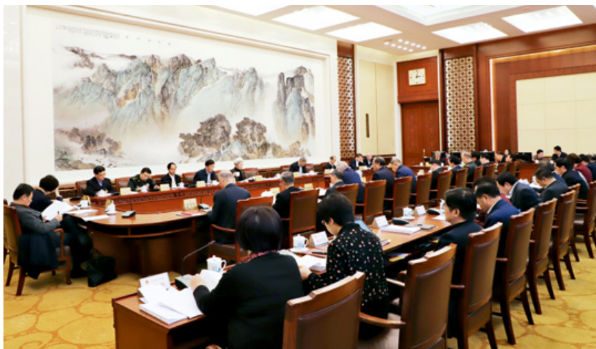
在强化公共卫生法治保障立法修法工作计划拟制定、修改的法律中，生物安全法草案等法律案已提请审议。图为2019年10月25日，十三届全国人大常委会第十四次会议分组审议生物安全法草案。

法修法工作计划到2020年度立法工作计划，进一步细化了公共卫生领域立法修法的时间表、路线图