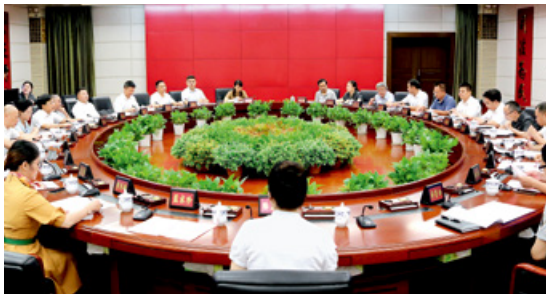
2019年8月，自治区高级人民法院、自治区工商联召开联席会议暨民营企业座谈会

2019年，全区法院执结涉民营企业案件3359件、金融债权案件12125件，执行到位107.6亿元，有力维护胜诉方权益，助推企业健康发展；审结涉企业纠纷案件115261件，维护了公平竞争的市场