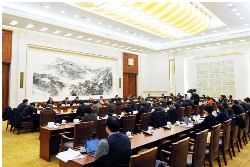
2018年12月26日,十三届全国人大常委会第七次会议分组审议民法典合同编草案等。

市场经济是法治经济,也是信用经济,合同制度是维护市场经济的基本法律制度。诚信原则要求当事人在订立、履行合同及合同终止后的全过程,都要心怀善意,诚实守信,相互协作,不得滥用权利。强调诚信原则,对当事人的行为进行规范,可以防止当事人滥用权利,有利于平等保护当事人的合法权益,是现代合同法发展的重要趋势,也是商业道德的重要体现。