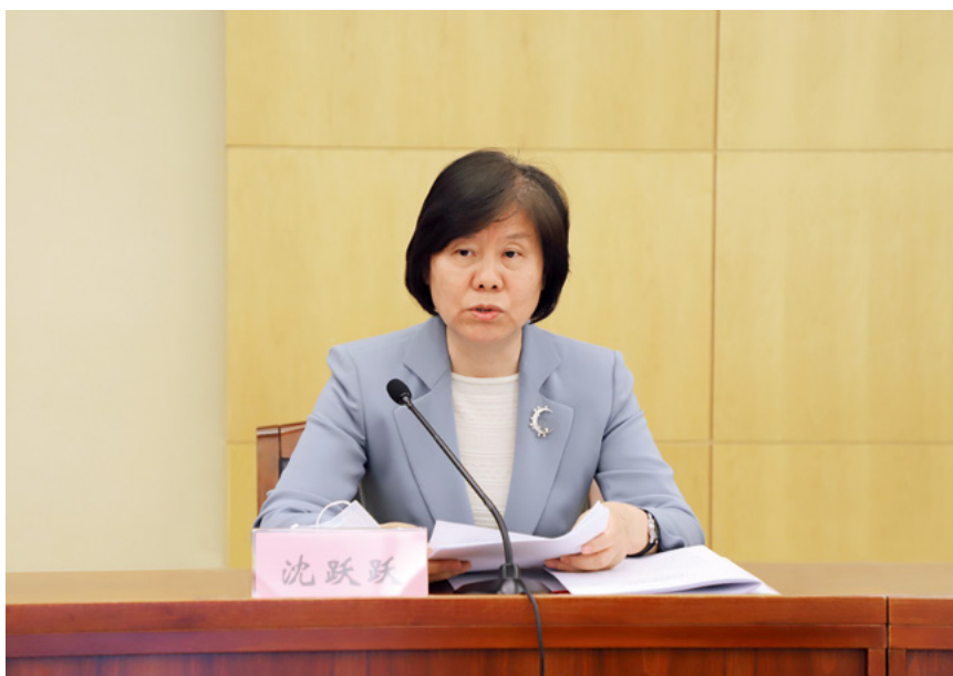
2020年5月8日，沈跃跃副委员长出席全国人大环境与资源保护工作座谈会并讲话。

以习近平同志为核心的党中央高度重视生态文明建设，习近平总书记始终把生态文明建设与经济社会发展同步研究部署、统筹推进落实，提出一系列新理念新思想新战略新要求，为加强生态环境保护、推进生态文明建设提供了根本遵循。全国人大常委会坚决贯彻党中央决策部署，把推进生态文明建设作为立法监督的重点，加大力度持续推进。栗战书委员长高度重视，亲自推动落实，依法推进生态文明法治建设。全国人大环资委在全国人大及其常委会的坚强领导下，不忘初心、牢记使命，坚持党的领导、人民当家作主、依法治国有机统一，增强“四个意识”，坚定“四个自信”，坚决做到“两个维护”，深