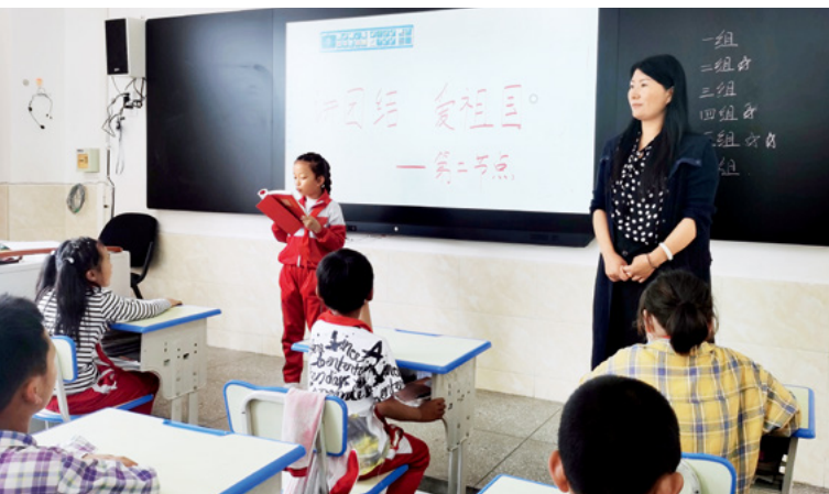
2020年7月，全国人大代表格桑德吉在墨脱县完全小学给孩子们上课，讲授“四讲四爱”内容。