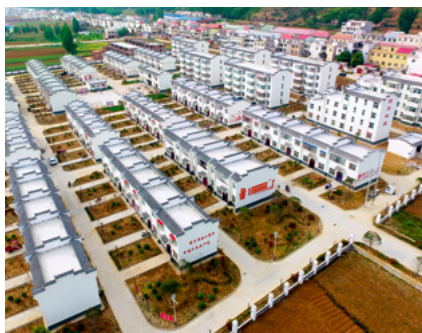
河南省淅川县寺湾镇易地扶贫搬迁安置点——前进社区鸟瞰图

河南省2012年共有53个贫困县，其中国家级贫困县38个、省级贫困县15个，815万农村贫困人口，贫困人口总量居全国第三位。党的十八大以来，全省上下坚持以习近平新时代中国特色社会主义思想为指导，深入学习贯彻习近平总书记扶贫重要论述，以脱贫攻坚统揽经济社会发展全局，把脱贫攻坚作为锤炼“四个意识”的大熔炉、转变工作作风的突破口、检验干部能力的新标杆、推进发展的新机遇，坚持“省负总责、市县抓落实、乡村组织实施”的工作机制，坚持精准扶贫精准脱贫基本方略，坚持大扶贫格局，尽锐出战、合力攻坚，取得决定性进展。