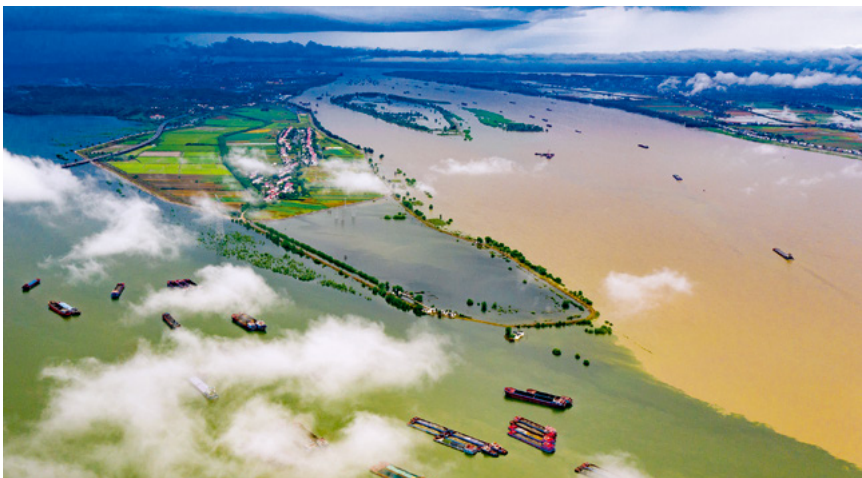
7月27日,江西省九江市湖口县,鄱阳湖和长江交汇处呈现“泾渭分明”的两色景观。

“我住长江头,君住长江尾。日日思君不见君,共饮长江水。”源远流长的长江哺育了璀璨的中华文明。习近平总书记指出,长江是中华民族的母亲河,也是中华民族发展的重要支撑。