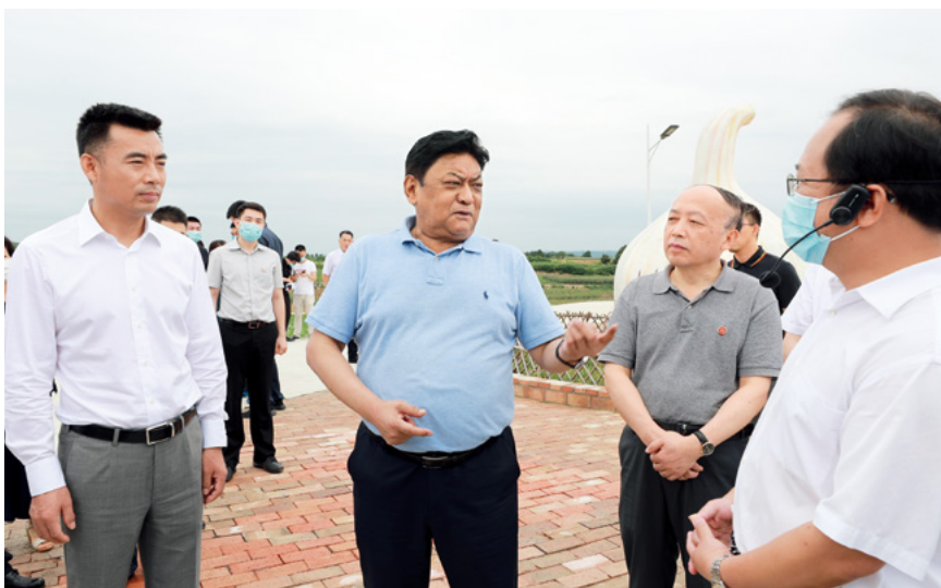
全国人大常委会副委员长白玛赤林率执法检查组在四川开展农业机械化促进法执法检查。