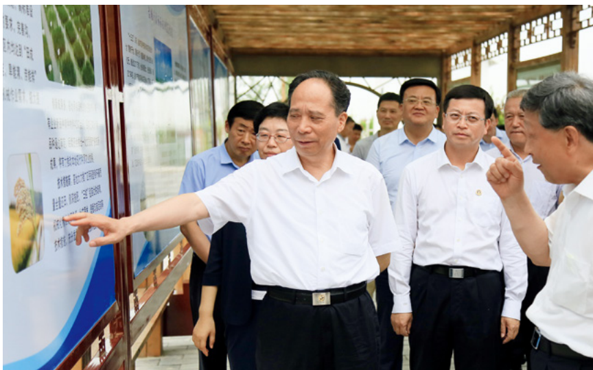
全国人大常委会副委员长吉炳轩率执法检查组在江苏开展农业机械化促进法执法检查。