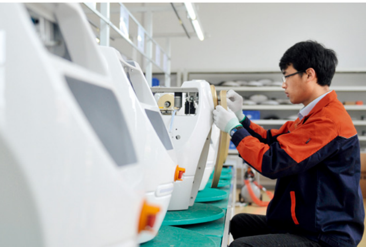
2019年4月29日，在山东省日照市经济技术开发区高新技术产业园内，一名工程师组装机器人。

根据《全国人大常委会2020年度工作要点》和《全国人大常委会2020年度监督工作计划》，各有关专门委员会和常委会工作委员会制定了专题调研工作方案。其中，财政经济委员会围绕产业优化升级和产业链、供应链、价值链布局调整完善，通过召开座谈会、实地考察等方式进行调研，并形成专题调研报告。据悉，该报告将提请十三届全国人大常委会第二十一次会议审议。✘