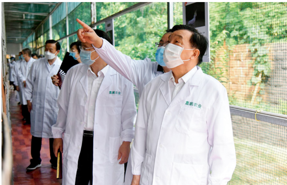
7月13日至16日，中共中央政治局委员、全国人大常委会副委员长王晨率全国人大常委会执法检查组在江西检查全国人大常委会全面禁食野生动物有关决定和野生动物保护法实施情况。这是7月15日，王晨同志一行在贵溪市嘉鹏农业发展有限公司进行检查。

这里再讲一下全国人大常委会为什么要制定《决定》。刚才说到我国有7300多种脊椎动物，其中列入国家重点保护野生动物名录禁止食用的仅有406种。对于“三有”野生动物和其他非保护类陆生野生动物，数量很大，此前是没有明确规定禁止食用的，这就成为了威胁人民群众生命健康的一个风险点。在实践中，一些动物很难区分到底是野外生长还是人工驯养的，工作中也缺乏相关的明确标准，这就为一些欺骗消费者和规避监管的行为提供了条件，造成了市场鱼目混珠的乱象。根据上述情况，我们这次调整立法思路，通过《决定》全面禁止食用野生动物，同时规定列入国家畜禽遗传资源目录的动物属于家畜家禽，大部分是可以食用的品种，这个目录是动态调整的。这样一来，除列入国家畜禽遗传资源目录的动物和鱼类等水生野生动物外，其他野生动物全部被禁止食用。我国历史上一直有食用野生动物的习俗，应该说《决定》的出台是一场移风易俗的深刻革命，对于革除滥食野生动物陋习