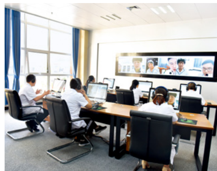
河南省平舆县“互联网+健康扶贫”分级诊疗平台