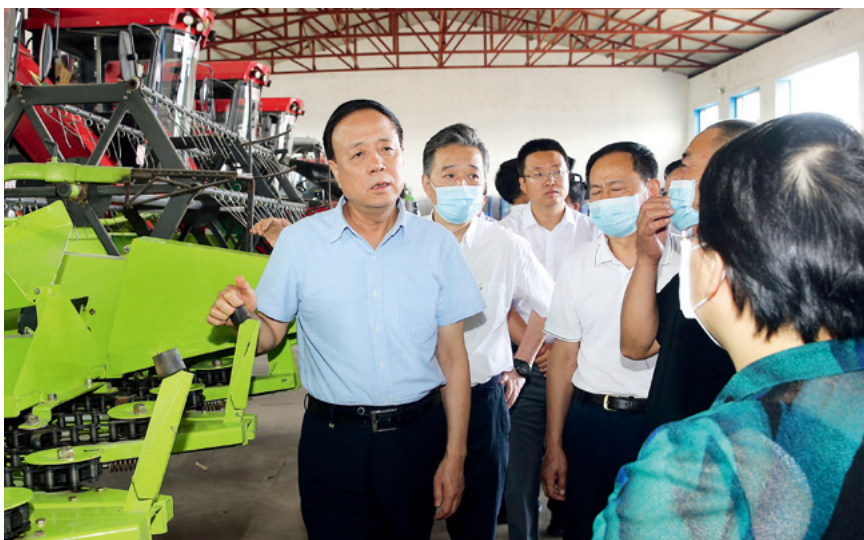
全国人大常委会副委员长武维华率执法检查组在吉林开展农业机械化促进法执法检查。