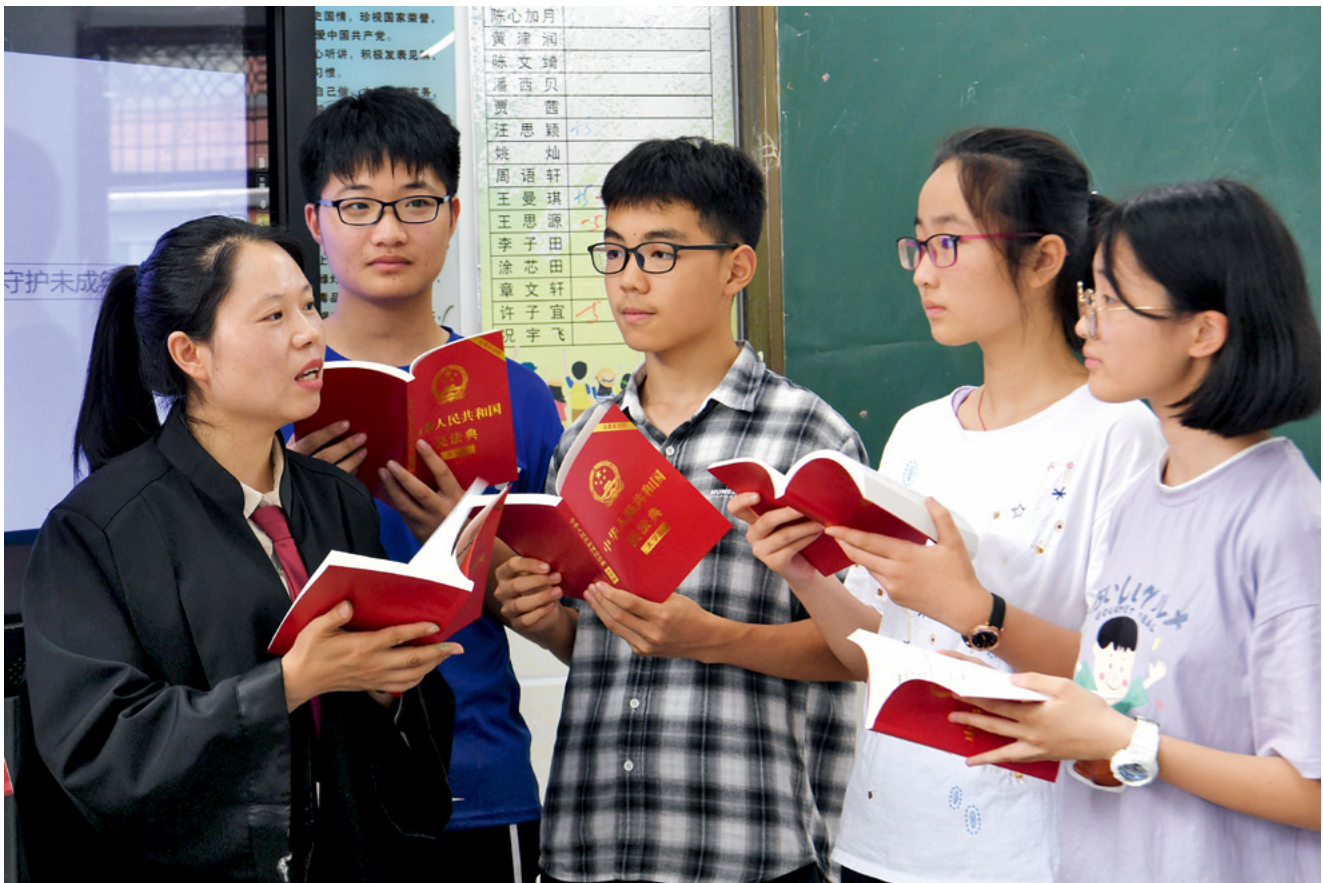
6月18日，安徽合肥滨湖世纪社区平安建设部工作人员走进学校，面向中学生开展民法典关于未成年人保护的专题讲座，让青少年进一步了解自己享有的法律权利，树立法治观念，更好地保护自己。