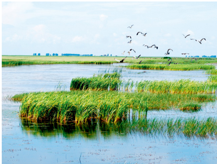
近年来,黑龙江省牢固树立“绿水青山就是金山银山”的理念,打好蓝天、碧水、净土保卫战,绘就了一幅生态新画卷。图为退耕后的三环泡湿地。

三要坚持践行绿色发展理念。习近平总书记强调,“实践证明,经济发展不能以破坏生态为代价,生态本身就是经济,保护生态就是发展生产力。”实践充分证明,只有坚定不移走生态优先绿色发展之路,让生态优势变为发展优势,才能促进经济高质量发展。