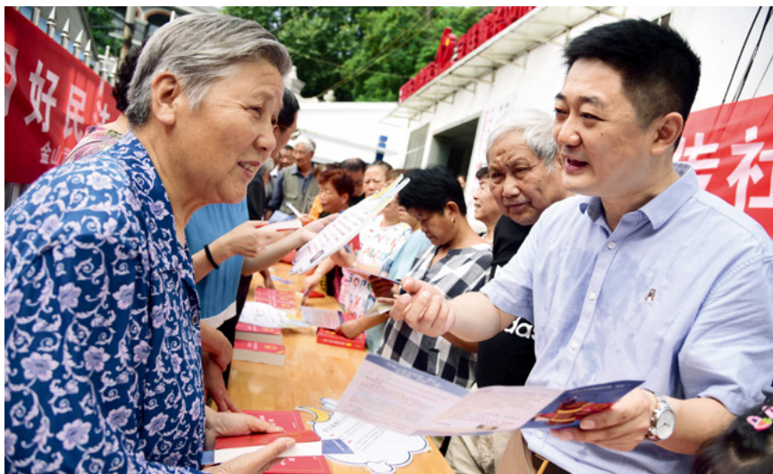
7月10日,在江苏省镇江市风车山社区,律师在向居民宣讲《中华人民共和国民法典》及相关法律知识。