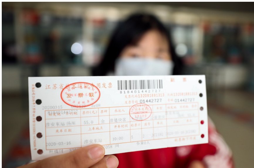
为维护正常的运输秩序，保护乘客在运输过程中的人身、财产安全，合同编对运输合同部分作出有针对性的规定。图为3月15日，在江苏淮安汽车客运东站，一名乘客展示购买到的车票。图/中新社发 赵启瑞 摄