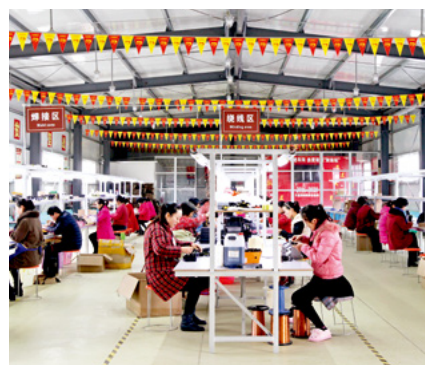
河南省台前县马楼镇扶贫车间

五是探索了新时代农村工作方法。 通过实行精准方略，不仅最大程度地发挥了政策效益、资金效益、项目效益，而且使广大干部树立了精准理念、培养了精准能力、掌握了精准方法，实现了工作方式由粗放式向精细化的转变，为做好新时代农村工作探索了有效路径。