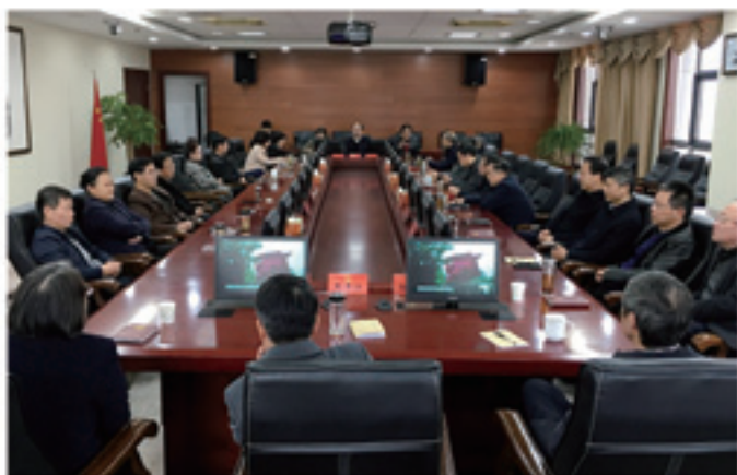
2019年11月28日，市人大常委会“不忘初心、牢记使命”主题教育领导小组组织机关党员领导干部开展警示教育。