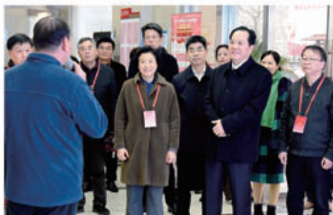
2019年12月17日，市人大常委会组织部分市人大常委会委员、代表视察我市文化场馆和基础建设情况。