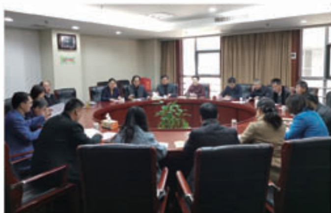
2019年12月5日，市人大机关委员会第一党支部组织召开“不忘初心、牢记使命”主题教育专题组织生活会。