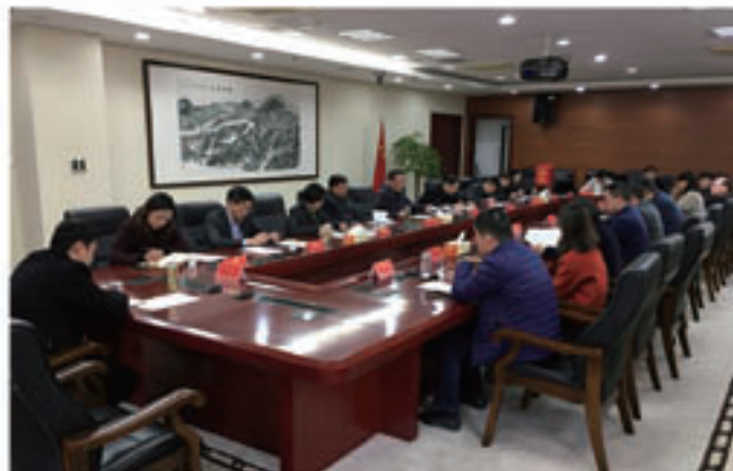
2019年12月10日，市人大机关委员会第二党支部组织召开“不忘初心、牢记使命”主题教育专题组织生活会。