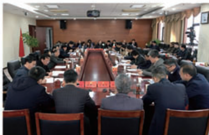
2019年12月12日上午，市人大常委会组织召开市八届人大四次会议筹备工作第一次会议。