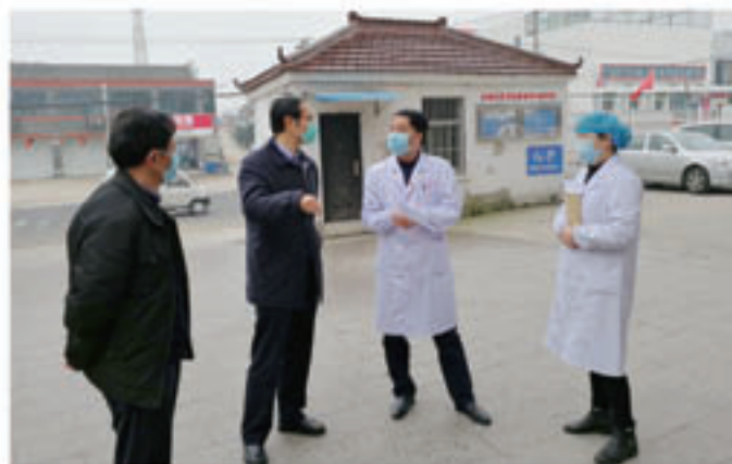
市人大常委会副主任岳卫平赴句容市走访慰问