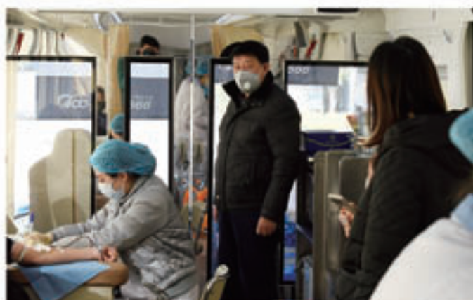
2020年2月18日，市人大机关党委组织开展“抗击疫情、捐献热血、奉献爱心”无偿献血活动。