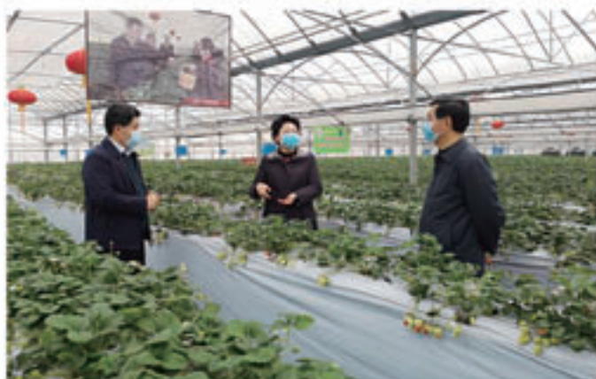
市人大常委会副主任陈琳赴丹徒区走访慰问