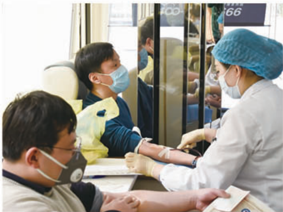
2020年2月18日,市人大机关党委组织开展“抗战疫情、捐献热血、奉献爱心”无偿献血活动。市人大机关19名同志积极参加献血,献血总量达到5500毫升。