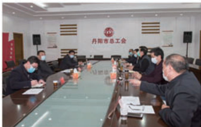
市人大常委会副主任王常生赴丹阳市走访慰问