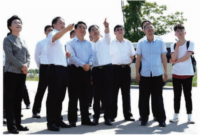
2019年5月23日下午,省人大常委会常务副主任、党组书记陈震宁率领执法检查组,来我市开展《水污染防治法》执法检查。市长张叶飞陪同执法检查。市人大常委会副主任陈琳陪同执法检查,并汇报了我市人大开展《水污染防治法》执法检查情况。市人大常委会秘书长丁羽如,副秘书长周义平陪同执法检查。