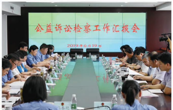
2019年6月19日上午，市人大常委会副主任陈琳带队赴丹阳市，调研检察机关公益诉讼工作。市检察院检察长张新祥，市人大常委会副秘书长张纪成参加调研。