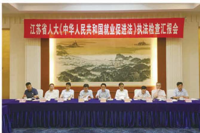
2019年6月21日，省人大常委会常务副主任陈震宁率队，来镇开展《中华人民共和国就业促进法》执法检查。市长张叶飞、市人大常委会常务副主任张洪水陪同执法检查。省人大常委会秘书长陈蒙蒙参加执法检查。副市长许文陪同执法检查并作情况汇报，市人大常委会秘书长丁羽如陪同执法检查。