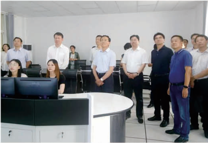
2019年7月12日，市人大常委会常务副主任张洪水、市政府副市长陈金观赴辛丰镇，调研社会治理、网格化建设工作。