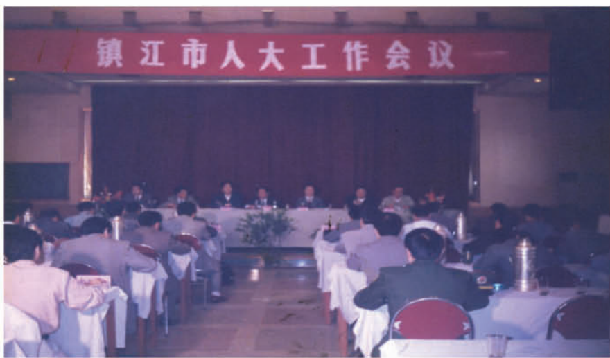
1995年3月25日，镇江市委召开人大工作会议。

2015年10月9日，市委召开全市基层人大工作规范化建设座谈会，对充分发挥基层人大和人大代表的作用，扎实推进镇江基层人大规范化建