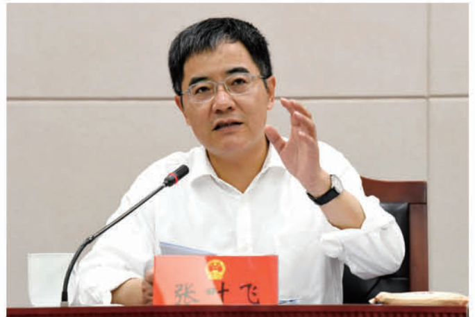
市长张叶飞作政情通报