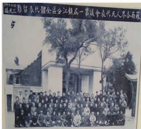
(1949年10月31日,苏南各界人民代表会议第一届镇江分区代表)