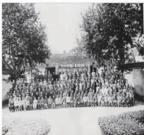
(1949年9月,镇江市第一届人民代表大会召开)

毛泽东同志曾经说过:“人民,只有人民,才是创造世界历史的动力。”恩格斯曾经说过:历史活动是群众的事业。决定历史发展的是“行动着的群众”。人民群众是历史的创造者,是创造世界历史的动力。中华人民共和国的一切权力属于人民。人民行使国家权力的机关是全国人民代表大会和地主各级人民人表大会。