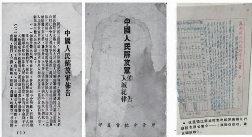
(军管会接管活动及文件)

思、恩格斯总结巴黎公社失败的教训,得出了坚持工人阶级政党的领导是科学社会主义的一条根本原则。