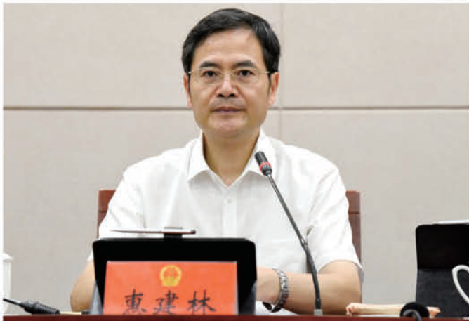
市委书记、市人大常委会主任惠建林主持政情通报会并讲话。