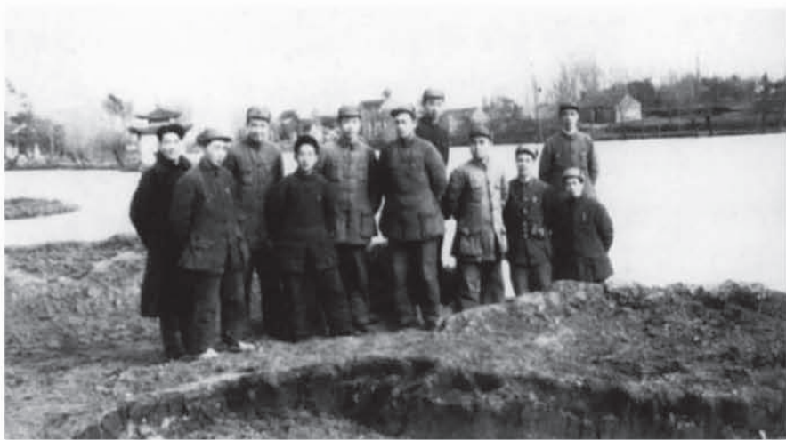
(1949年4月,在苏北组建的镇江地、市委领导人合影)

1949年4月23日,中国人民解放军横渡滚滚长江,以排山倒海之势,一举占领具有3000多年历史的江南古城镇江,镇江人民迎来彻底解放。镇江解放当天,经中共华中工委批准,中共镇江地方委员会(简称中共镇江地委)和苏南行政区镇江专员公署(简称镇江专署)正式成立。原镇江县划分为镇江市和丹徒县,城区