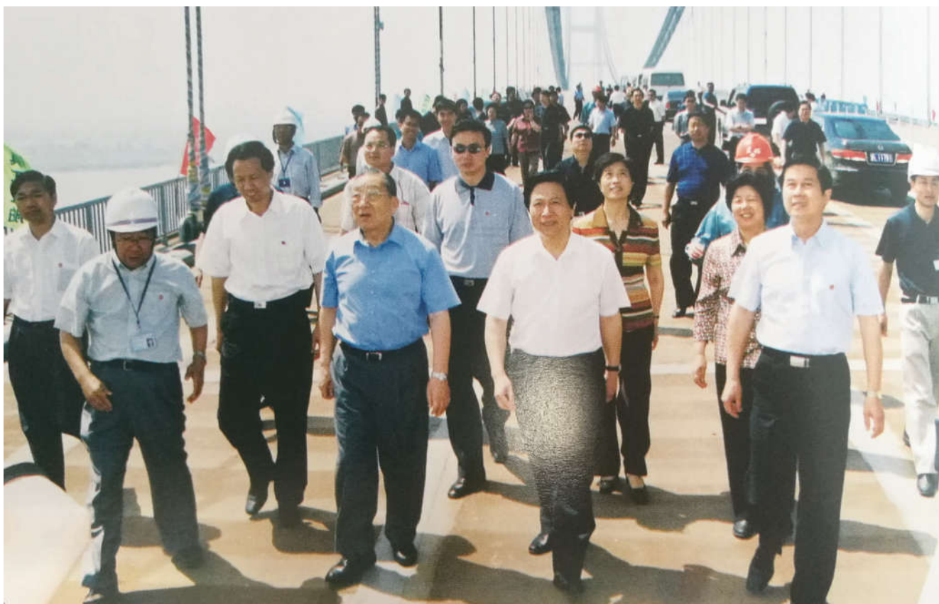
2004年6月12日、13日,原中共中央政治局常委、国务院副总理李岚清(左四)察看润扬大桥

改革时代,激发伟大力量、凝聚伟大智慧、创造伟大成就、焕发伟大精神。2004年6月,润扬大桥(全称润扬长江公路大桥)全面建成通车,这是我国成功改革开放的又一历史见证,这是当时镇江人民奔走相